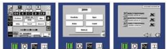
ИЧМ с сенсорным экраном управления с различными методами резки и базой данных с программами резки и сервисным мониторингом