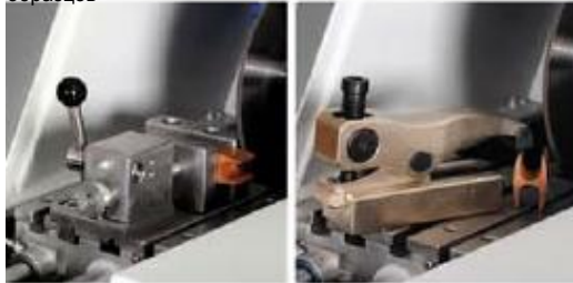
Быстродействующий блок зажимных тисков Вертикальное зажимное устройство