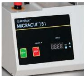
Цифровой дисплей MICRACUT 151

Поставляется опционное приспособление к столу для резки для ручной резки образцов больших размеров и печатных плат.