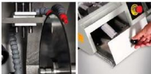
Устройство для правки лезвий; способно выполнять правку даже во время резки Емкость для охлаждающей жидкости 4,5 л для рециркуляционной системы охлаждения