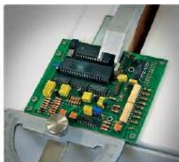
Приспособление к столу для резки плоских образцов и печатных плат