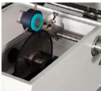
Для различных применений поставляется разнообразные тиски для образцов