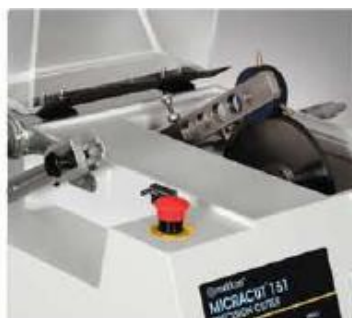
Скользящая консольная рука, установленная в удобном положении